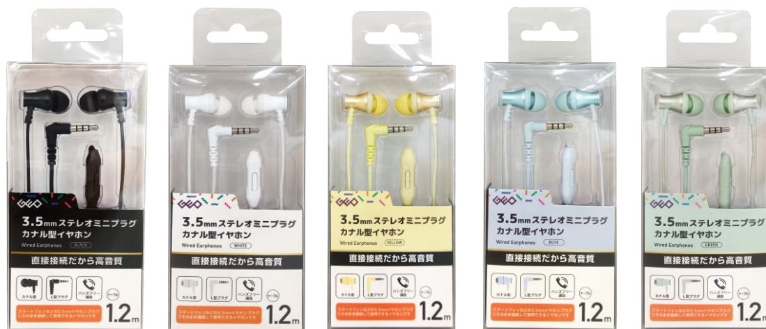
<パッケージ画像 (左からブラック、ホワイト、イエロー、ブルー、グリーン) >

https://geo-online.co.jp/campaign/special/other/geoselection/earphones/grtwe-iepc21e30.html