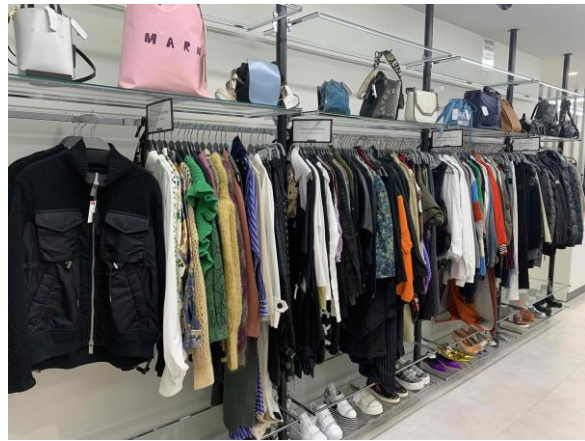
< 『セカンドストリートスペイン坂店』 売り場 >