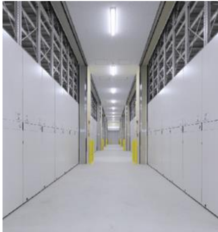
<管理体制の整備された2nd STORAGE 倉庫>