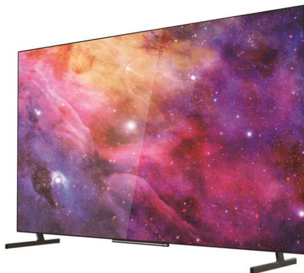
<製品イメージ画像>

ゲオは、生活向上に役立つ各種をオリジナルブランドとして積極的に展開し続けています。今般のテレビも、その一環として販売いたします。