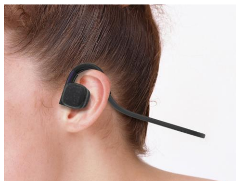
<着用イメージ画像>