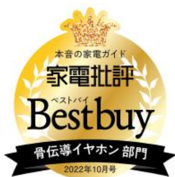
<家電批評ベストバイ受賞ロゴ>