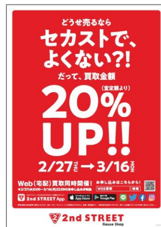
<キャンペーンPOP画像>